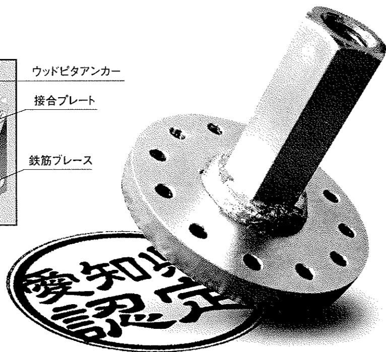
▲ウッドピタアンカー