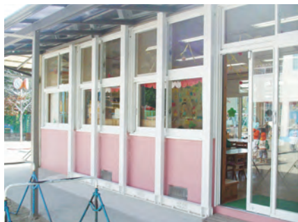
木造幼稚園舎(愛知県)