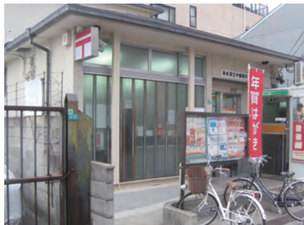
木造郵便局(大阪府)