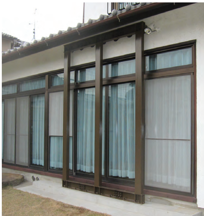
縁側や大きな開口部にも最適なフレームタイプ

ウッドピタ工法は、「登録建築士」になっていただくことにより、補強計画にご採用いただけます。 所定の要件を満たす方であれば、お申し込みの上、無料講習会を受講していただくことで登録できます。 ※諸条件については(株)ウッドピタまでお問い合わせください。